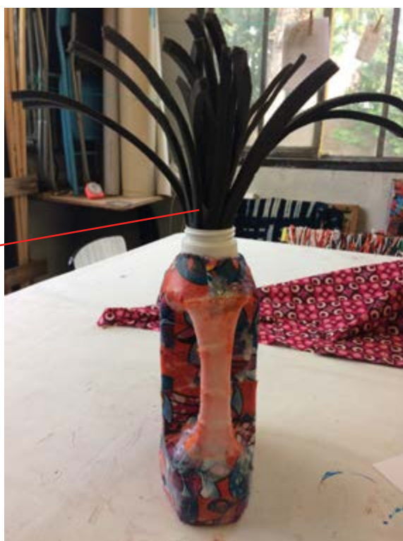
morceaux de tapis de gym